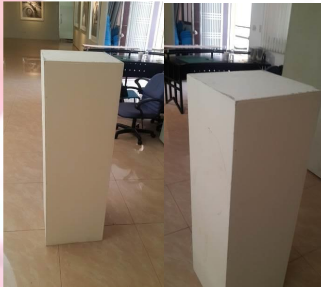
圖一 競賽會場展示台